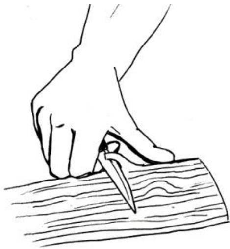
Käärlõige.

Käärlõike nimetus tuleb sellest, et tegevus meenutab pisut kääre. Nuga on üheks kääride haruks ja põial teiseks. Puutükki hoitakse harilikult vasakus (vasakukäelistel vastupidi) käes, parema käe neli sõrme hoiavad noapead ja põial toetub vastu puud lõikepinnast madalamal. Sellisel moel lõigates puudub vigastusoht. Halvimal juhul võib tulemuseks olla vaid naha kriimustus, sest nuga on põidlani jõudes juba oma liikumisjõu kaotanud.