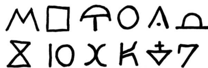
Valik peremärke. Joonis: Jane Remm

Peremärk oli päritav, iga järgmine põlvkond täiendas seda. Peremärkide kasutamine hakkas Eestis vähenema seoses kirjaoskuse levikuga 19. sajandil. Tänapäeval võib kasutuses olevaid peremärke leida vaid rannaäärsetes külades, kus neid esineb veel kalavõrkude ujukitel.