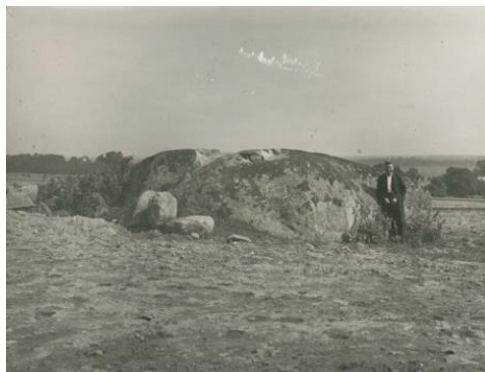
Salla suur ohvrikivi, Simuna khk, ERM Fk 484:81, Eesti Rahva Muuseum. http://www.muis.ee/et/museaalview/653081