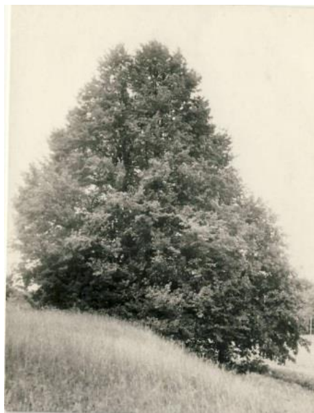
Ilumäe hiiepuu, RM F 947:21, SA Virumaa Muuseumid. http://www.muis.ee/et/museaalview/1639691

Riigil puudub praegu ülevaade valdava osa looduslike pühapaikade asukohast ja seisundist, mistõttu ei ole võimalik nendega erinevates planeeringutes ka arvestada. Nii pühapaigad hävivad või kahjustatakse neid teadmatuses.