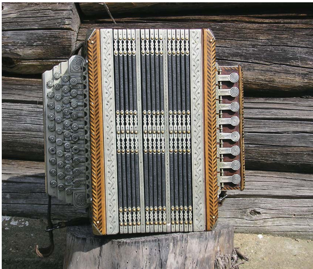
Aastal 1915 valmistatud löötspill.

Uue löötspilli valmistamiseks kulus meistril vähemalt pool aastat aega, sest pillitööd võeti kui harrastust, mida tehti enamasti talvel, kui oli talutööde vaheaeg. Kuni aastani 1910 tegi ta umbes ühe pilli aastas, rohkem ei jõudnud – katsetas ja proovis uusi töövõtteid, materjale. Hiljem aga kaks aastat. Võib öelda, et 1910. aastaks oli Teppo lõõts välja kujunenud. (6) Pillide erinevused piirduvad edaspidi ainult kas keeleraudade arvu (kooride) või väliste elementidega (kaunistused).