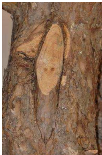
RMK saepalkide kvaliteedistandard. 2010. Riigimetsa Majandamise Keskuse koduleht. http://rmk.ee/files/Palkide_standard_21.05.2010_piltidega.pdf

Rahanapp on kasetohust, pealelukatava puukaanega. See on kodus tehtud ja seda tarvitati raha hoidmiseks.