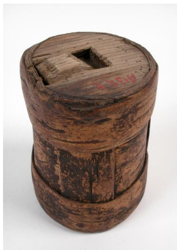
Rahanapp. ERM A 132:2 Sangaste, Eesti Rahva Muuseum. http://www.erm.ee/et/Avasta/Kihelkonnad/Sangaste-kihelkond

Suurematel jõgedel olid tarvitusel kerged haavapuust vened kumerate laialipainutatud külgedega. Need olid üsna liikuvad, manööverdamisvõimelised ja hea kandejõuga veesõidukid. Fotol on Matsalus vette lastud kolm lootsikut ehk ruubat, mis valmisid Keskkonnaameti projekti raames.