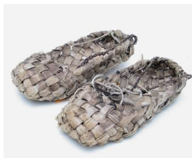
Viisud. EPM4292/abE2373/ab

Tulioks männil. Ehituspalgil ei tohtinud olla sees „tulioksa“, mis oleks võinud põhjustada tulekahju. Arvati, et tulioksaga majja lööb pikne või et palk läheb ise põlema.